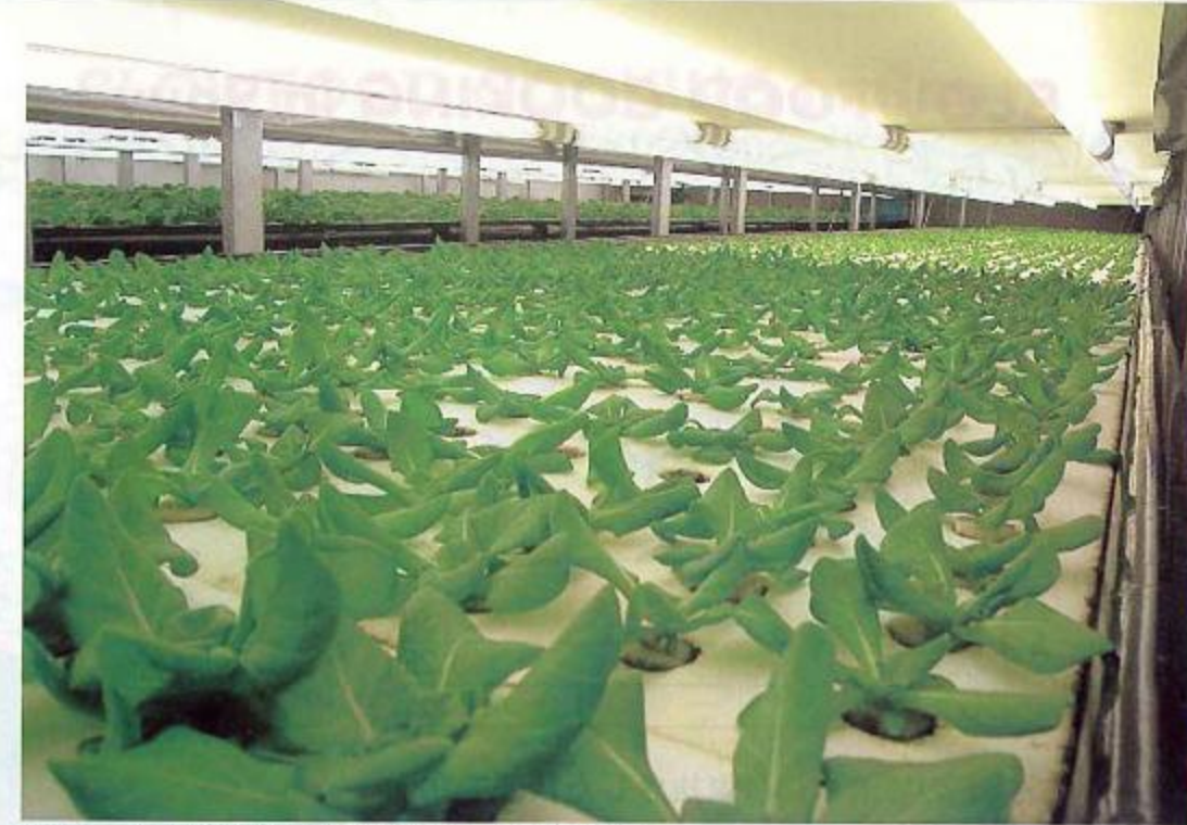
写真1 蛍光灯を使用した育苗の様子 (M式水耕製)