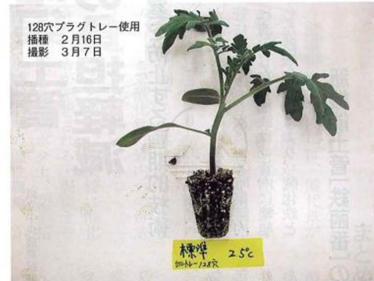
写真3 人工光育苗した中玉トマト (カンバリ) の苗 (閉鎖型育苗装置「苗テラス」にて育苗)