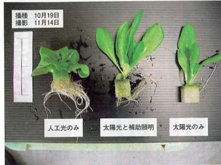
写真2 光源を変えて生育させたサラダ菜苗 (閉鎖型育苗装置「苗テラス」にて育苗)

みなさんは人工光で育苗された植物の生育にどのようなイメージを持たれるだろうか? 実際にどのような苗が生産されるのか、いくつかの例をあげて説明したい。